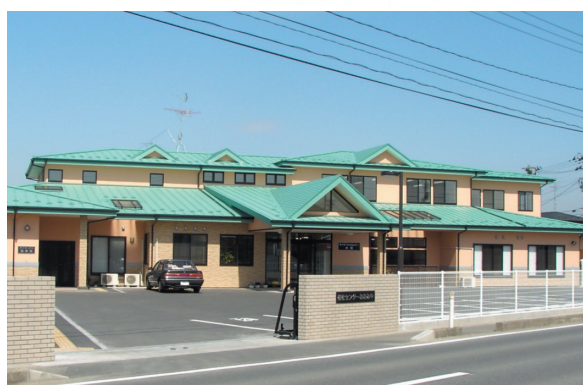
古川大宮居宅介護支援事業所