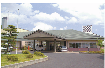
特別養護老人ホーム 敬風園(鹿島台)