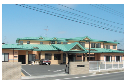
福祉センター おおみや(古川)