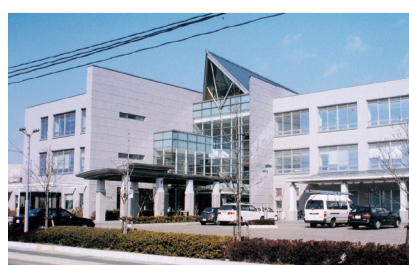
本所〔法人本部〕(大崎市古川保健福祉プラザ内)