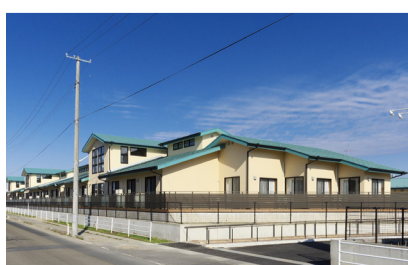
特別養護老人ホーム 楽々楽館(古川)