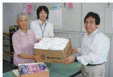
▶大崎商工会女性部 三本木支部 様