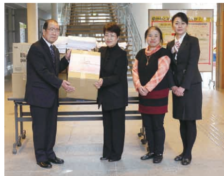
▶(公社) 大崎法人会 女性部会様