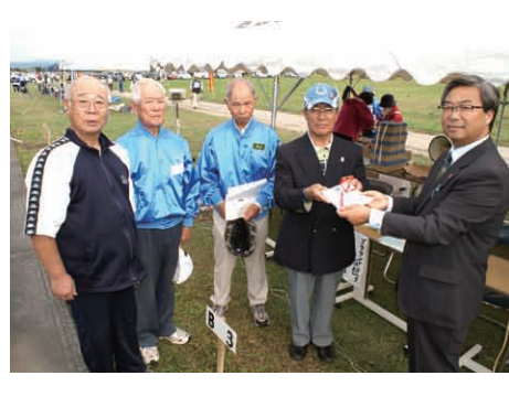
▶宮城県グラウンドゴルフ協会様