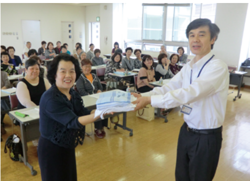
古川ボランティア連絡会 様