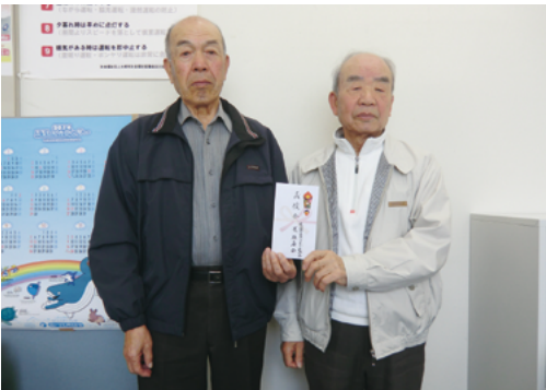
荒雄地区老人クラブ連合会 荒雄寿会 様