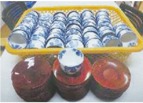
鳴子ホテル マネジメント株式会社 様