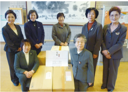
古川地域婦人団体連絡協議会 様