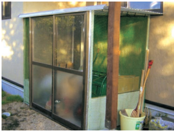
▶鈴木 勝様 グループホーム和楽路 ゴミ収納小屋