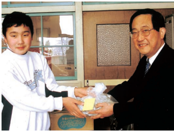
▶鹿島台小学校 ボランティア委員会様