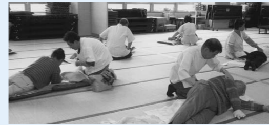
敬老無料マッサージの様子

9月14日(金)敬老の日になんで、宮城県はり灸マッサージ指圧師会大崎支部の方々のご協力により開催されました。参加された皆さんの疲れもとれ、明日への活力も湧いて来たとの喜びの声であります。