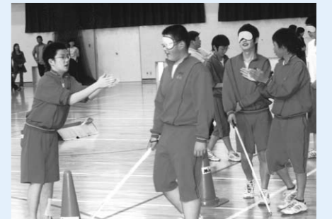
古川西中学校での様子

今年度は、東大崎小学校(4年生)、古川西中学校(2年生)、高倉小学校(4・5・6年生)において、社会福祉協議会より講師を派遣してキャップハンディ体験学習を実施しており、今後もこうした体験を通じて思いやりの心をもって障害を持たれた方々へ接する心を養ってきたいと考えております。