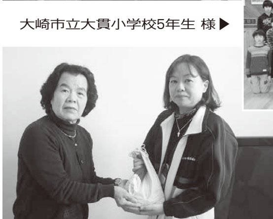
大崎市立大貫小学校5年生様▶