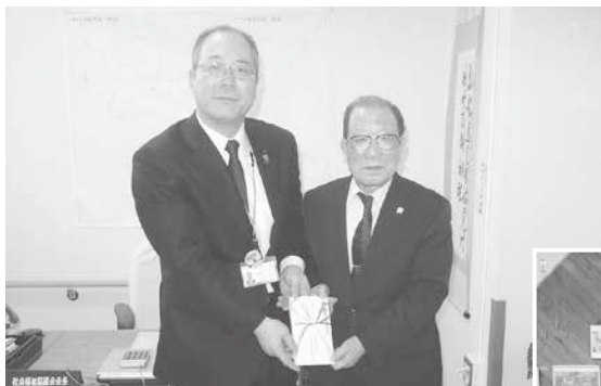
◀古川農業協同組合様