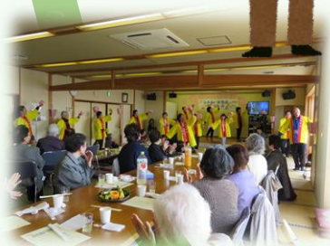
ふれあい食事会事業 （田尻）