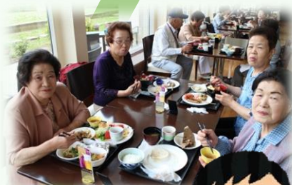
茶友会事業 （鹿島台）