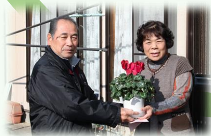
サンサンふれあい訪問 （松山）