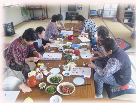
高齢者のつどい事業

地域の食事サービスやサロン活動で、顔の見える関係をつくることで、「時間を間違えるようになった」「衣服が汚れている」「最近姿を見せなくなった」などさまざまな変化に気づくことができます。地域活動における集いの場は、そのようなちょっとした変化の「 気づき 」の場であり、また、その場に来ない・来られない人の暮らしにも目を向けていくことが大切です。