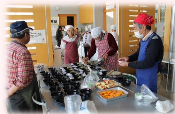
ボランティア養成講座

「地域で何かしたい」「自分も何かできることがあれば」…そんな思いを持ちながら、地域活動との接点がない方もいらっしゃいます。見守り活動に限らず、地域活動の 担い手不足 が課題となっている中、新たなボランティアを養成するための講座を開いたり、メンバーを募集する取り組みも大切です。