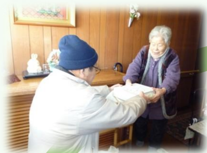
歳末まごころ訪問（古川）

地域で展開される「見守り活動」のほか、社協が実施する地域福祉事業に対する参加申し込みの声掛けや参加することでも、定期的な見守り活動に繋がります。