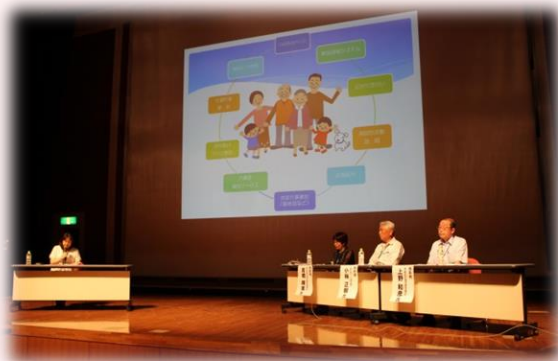
地域見守りネットワーク フォローアップ研修

具体的には、学識者を招いた学習会や、日頃の活動のふりかえりにより機運を高める取組み、特徴的な活動をすすめる他地域への視察・事例報告などの方法があります。