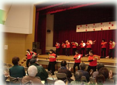
福祉のつどい事業（三本木）