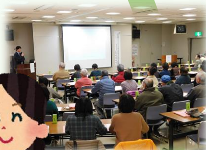
見守り活動 推進セミナー （岩出山）