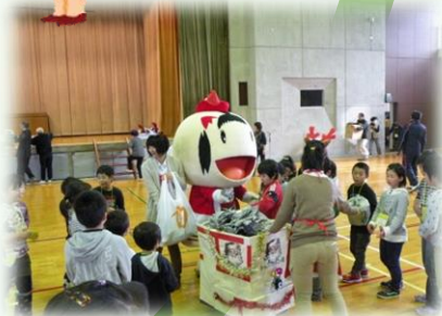
世代間交流事業 （鳴子）