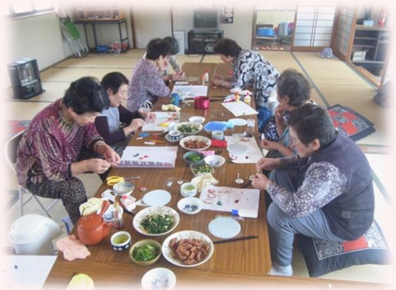
高齢者のつどい事業

地域の食事サービスやサロン活動で、顔の見える関係をつくることで、「時間を間違えるようになった」「衣服が汚れている」「最近姿を見せなくなった」などさまざまな変化に気づくことができます。地域活動における集いの場は、そのようなちょっとした変化の「 気づき 」の 場 であり、また、その場に来ない・来られない人の暮らしにも目を向けていくことが大切です。