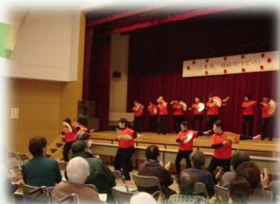
福祉のつどい事業（三本木）