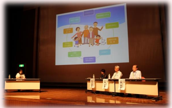
地域見守りネットワーク フォローアップ研修

具体的には、学識者を招いた学習会や、日頃の活動のふりかえりにより機運を高める取組み、特徴的な活動をすすめる他地域への視察・事例報告などの方法があります。