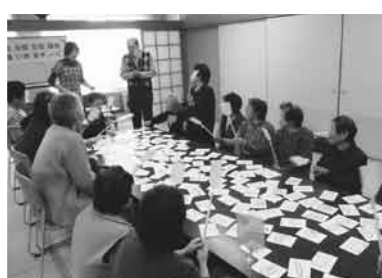
美味しく、また、会話が弾み楽しい時間を過ごすことが出来ました。

おおむね65歳のひとり暮らしの方を対象に、2月24日(火)・3月5日(水)・3月13日(金)の3回にわたり、鬼首基幹集落センター、鳴子保健・医療・福祉総合センター、川渡保健センターを会場に初の会食サービス事業を実施いたしました。 今回の開催に当たり、鳴子地区民生委員のご協力により参加者を募って頂きました。内容として、地域包括支援センターの講話「地域福祉事業について」、レクリエーションの研修を実施いたしました。笑って体を動かした後の会食はとても美味しく、また、会話が弾み楽しい時間を過ごすことが出来ました。