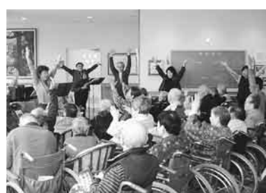
最後の「北国の春」や「ふるさと」では、参加された全員が園全体に響くような大きな声で合唱されます。

3月5日(水)、敬風園玄関ホールにて「出前コンサートそよかぜ」さんによるボランティアコンサートがありました。 月1回開催されるコンサートは、多くの参加利用者様から楽しみにされています。 季節に合った唄や手遊び体操、昔懐かしい唄などで約1時間があっという間に過ぎてしまいました。 この日は、皆さんがニコニコ顔で唄った「春の小川」、唄い出すと必ずと言っていいほど涙ぐむ人がいる「岸壁の母」、浮き浮き調子で唄い、身体も動いてくる「ドンパン節」、学校卒業の時泣き泣き唄った「仰げば尊し」、その他にも「ラバウル小唄」「さざんかの宿」など…… 最後の「北国の春」や「ふるさと」では、参加された全員が園全体に響くような大きな声で合唱されます。 来月はどんな曲が唄えるかな?楽しみます!