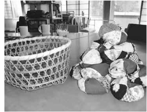
高橋 五十子 様

平成21年1月16日～3月13日受付分 (敬称略) ◎本所 特定非営利活動法人 宮城マネジメント協会 70,000円 ◎松山支所 松山総合支所保健福祉課 5,370円 ◎岩出山支所 大崎市立池月小学校 4学年 3,000円 皆様からお寄せいただいた募金は、宮城県共同募金会を通じて被災地に送られ、復興支援のために役立てられます。温かい善意に心より感謝申し上げます。