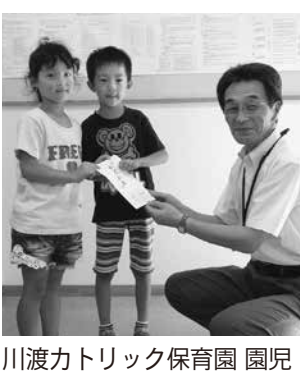
川渡カトリック保育園 園児・職員一同様

福祉の職場で働きたい方を募集しています。お気軽にお問い合わせ下さい。 ◆職種 保健師・看護職員・介護職員 ◆勤務地 ●地域包括支援センター(大崎市/古川・岩出山・田尻) ※保健師 ●特別養護老人ホーム 敬園園(大崎市鹿島台) ●特別養護老人ホーム 楽々楽館(大崎市古川) ●短期入所生活介護施設 楽々楽館(大崎市古川) ●通所介護事業所(デイサービスセンター)(大崎市/古川・鹿島台・岩出山・鳴子地域) ●訪問介護事業所等(大崎市/古川・鹿島台・岩出山・鳴子・田尻地域) ●生活介護事業所(大崎市鹿島台) ●共同生活介護(援助)事業所【ケアホーム】(大崎市/古川・鹿島台地域) ※なお、勤務地については相談により決定いたします。 ◆応募条件 ●保健師……保健師資格 ●看護職員……看護師資格(看護師・准看護師) ●介護職員……特になし ◆待遇 詳細については、当会給与規程に基づき決定いたします。パートタイムでの勤務可 ※勤務時間等相談に応じます。 ◆年齢/性別 不問 ◆応募 電話連絡の上、履歴書・資格証(写し)を送付ください。 【連絡先】社会福祉法人 大崎市社会福祉協議会 職員厚生課 〒989-6154 宮城県大崎市古川三丁目二丁目5-1(大崎市古川保健福祉プラザ3階) ☎ 0229-21-0550