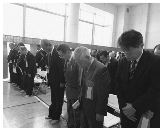
10月14日火 安全祈願地鎮祭が行われました

当協議会では、地域住民の方々からの要望・ニーズに応えるべく、デイサービスセンターの開設を主たる目的とし、総合福祉施設(仮称)田尻福祉センターを新設いたします。平成27年4月の開所を目指し、10月14日(火)に安全祈願祭が行われました。