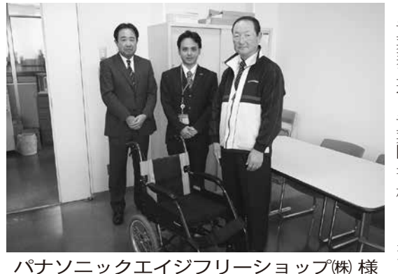
パナソニックエイジフリーショップ(株)様