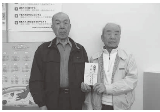
荒雄地区老人クラブ連合会 荒雄寿会 様