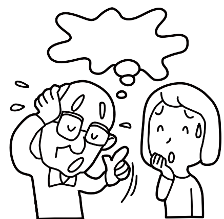
認知症フォーラムドットコム 検索

ここで、認知症の人には積極的に声をかけ、話を引き出すようにしよう。その際、ゆっくり、わかりやすく話すのがコツです。また、認知症の人は、いくつものことを同時に理解することが苦手です。「お風呂から帰ったから、手が汚れているかもしれないね、手を洗いなさい」と言っても、「外出」「汚れた手を洗う」と三つの話がでているので大混乱してしまいます。こういう場合は「手を洗いなさい」と声をかけるだけでいいです。