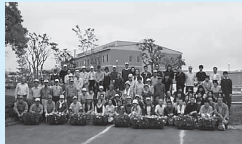
～1回目(平成24年6月30日)の様子～

当支所では、あつたか村フラワーロードの植栽事業を年2回開催しております。あつたか村の近隣住民のみなさんとあつたか村施設間の職員が協力し合って花を植え、色鮮やかなフラワーロードを作り上げます。