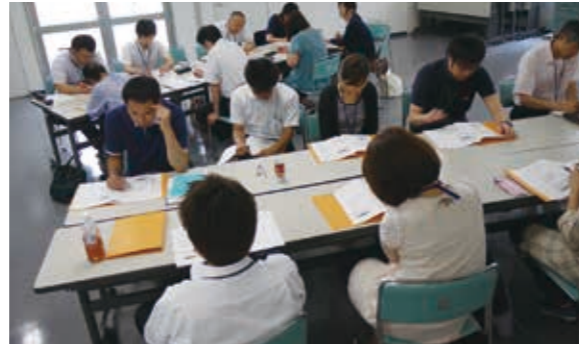
大崎市古川保健福祉プラザ