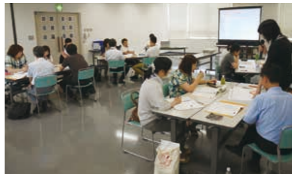
大崎市古川保健福祉プラザ