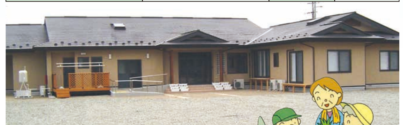
認知症グループホーム 和楽路