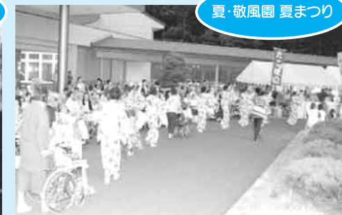
夏・敬風園 夏まつり