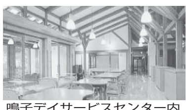
鳴子デイサービスセンター内