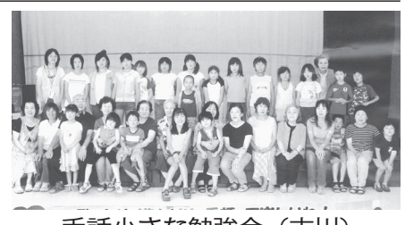
手話小さな勉強会(古川)

今回は、大崎市内、各地域における主なボランティア活動について紹介いたします。 ※会員数は、個人登録の方も含みます。 【古川地域】 構成団体数：20団体 会員数：318名 主な活動 ○大崎市社協事業への協力、地域活動 ○施設活動(障害者の援助活動・施設訪問等) ○環境美化活動 ○ボランティア研修会の開催 ○「広報ふるかき」の朗読、読み聞かせ ○手話学習、交流等 ○災害復旧活動・除草作業等 ○「花いっぱい運動」参加 ○ボランティア養成講座 ○ボランティア養成講座(古川)