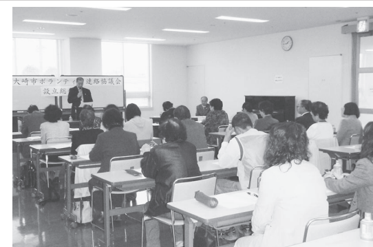
「大崎市ボランティア連絡協議会」設立総会にて

構成団体数：1団体 会員数：203名 主な活動 ○大崎市社協事業への協力、地域活動 ○施設活動(障害者の援助活動・施設訪問等) ○ボランティア(舞踊・ダンス・唄・楽器演奏等) ○技術ボランティア(資格や免許の活用・大工・理容・茶道・表具師等) ○趣味・特技ボランティア(折り紙・大工)