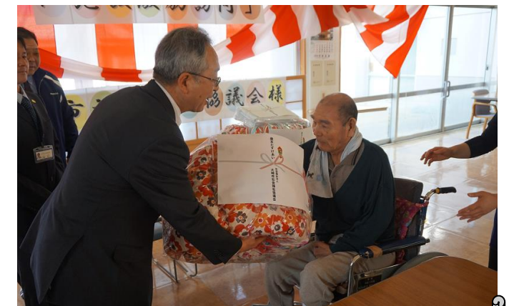
特別養護老人ホーム 「岩出の郷」様

皆様にご協力いただきました歳末たすけあい募金から温かいお正月を向かえて頂けるよう在宅福祉訪問事業として要保護世帯への「義援金贈呈」やひとり暮らし高齢者への「切り餅贈呈」また、施設激励訪問事業として車いす用クッション等を岩出山地域にある施設に12月末に訪問致しました。