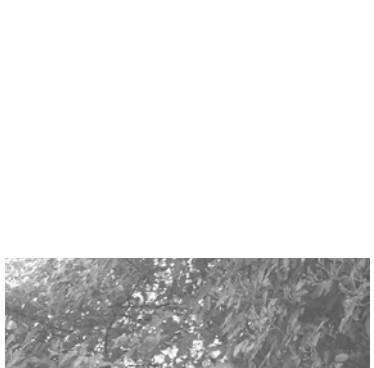
おひさま農園 角田秀徳 様