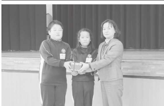
大崎市立古川第三小学校4年生一同 様