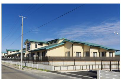
特別養護老人ホーム 楽々楽館(古川)