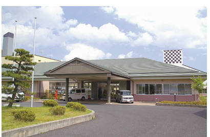
特別養護老人ホーム 敬風園(鹿島台)