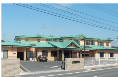
福祉センター おおみや(古川)