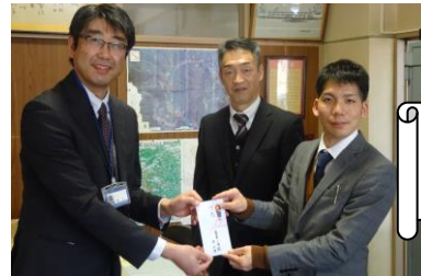
鬼首小学校様から 寄附を頂く様子