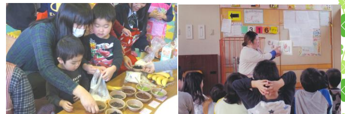
▲平成30年度世代間交流「親子クッキング」の様子（昨年度は中止）