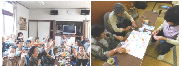
▲ふれあいサロンの様子（レクリエーション）