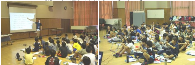
▲昨年度 福祉体験学習の様子（手話体験）

学生ボランティア育成、福祉出前講座、福祉レクリエーション講座、福祉体験学習事業 等