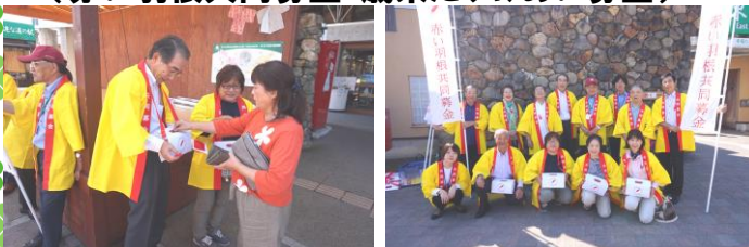
▲昨年度 街頭募金運動の様子