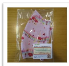
心のこもった手作りマスク