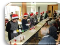
（漢と貴妃の生き方塾『ハンドベル教室 演奏会』）