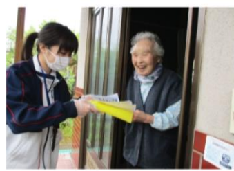
当社協職員による見守り訪問時の様子