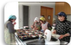
（配食サービス事業『ボランティアさんによるお弁当作り』）