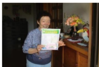
さんさん福袋を受け取り喜んだ様子の利用者さん

新型コロナウイルス感染症の影響で外出の機会が制限される中、4月22日～30日に「高齢者配食サービス事業・高齢者の生きがいと健康づくり推進事業・ひとり暮らし高齢者のつどい事業（コスモス会）等」を利用している方々に、当社協職員による 新型コロナウイルス感染予防と見守り訪問を目的として「さんさん福袋」をお届けしました。『福袋』には松山婦人会より地域で役立て頂きたいと寄付頂いた手作りマスクとぬり絵や折り紙等の脳トレグッズ、松山放課後児童クラブ児童の応援メッセージカードが入っており、受け取った方々からは「マスクが買えなかったので、手作りマスクありがたいです」、「他の方と、お話すること少なかったので職員さんが訪問してくれてうれしい」、「メッセージカードありがたい」等の声が聞かれ、とても喜んでいました。5月に2回目の見守り訪問を実施、外出自粛中に気を付けるポイント、特別定額給付金詐欺に対する注意喚起のチラシ等をお届けしました。6月にも3回目の訪問を予定しています。