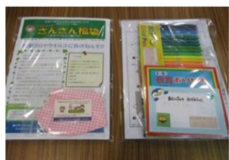
さんさん福袋（松山婦人会より寄付頂いたマスクや児童からのメッセージカード等が入っています）