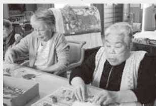
〈壁飾り作りの様子〉