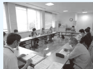
▲鳴子地区民児協打合せの様子