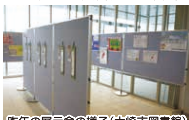
昨年の展示会の様子(大崎市図書館)