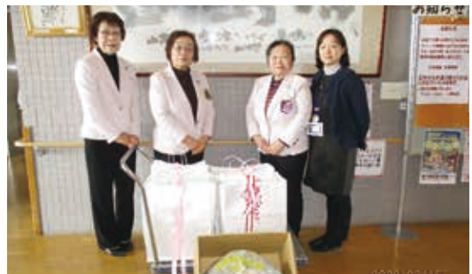
古川ライオネスクラブ 様