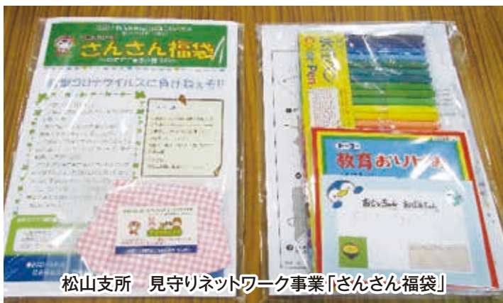
松山支所 見守りネットワーク事業「さんさん福袋」