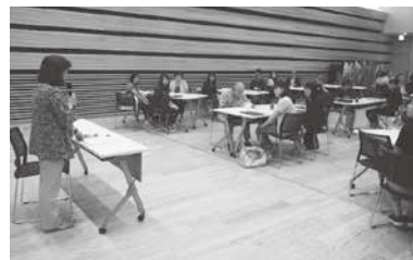
大崎市における地域住民の地域福祉推進に関する調査の様子

※当会の地域福祉活動計画[第3期]の策定経過については、ホームページ上にて随時掲載しておりますので、ぜひご覧ください。