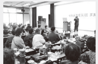
〈令和元年度「茶友会」の様子〉