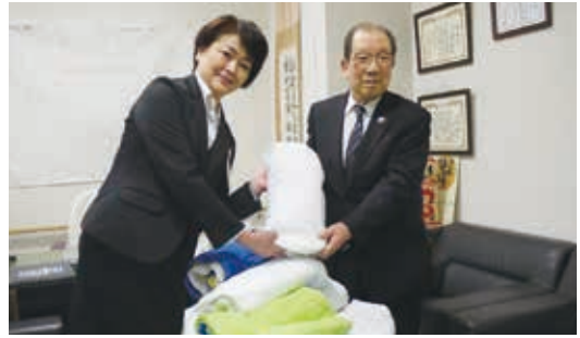
(公社) 大崎法人会女性部 様