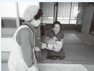
▲ひとり暮らし高齢者訪問イメージ写真

尚、「ひとり暮らし高齢者のつどい事業」の交流会型式での開催は、今後以降廃止となります事をお知らせ致します。