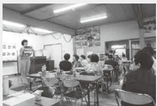
▲昨年度の講座の様子