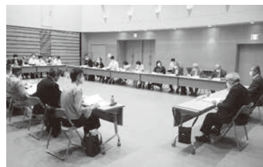
地域福祉活動計画策定委員会の様子

住民一人ひとりが住み慣れた地域において、安心して暮らし続けることができるように、地域で潜在化している多様な福祉課題の把握と課題解決に向けた地域の自主的な福祉活動を社協が支援するための具体的な取り組みを定めています。