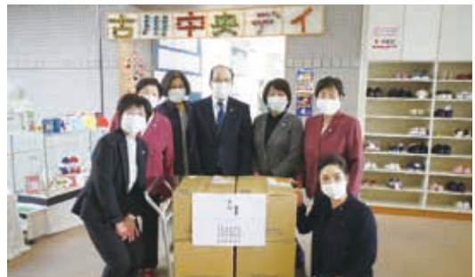
古川地域婦人団体 連絡協議会 様