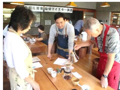
▲ボランティア養成講座(コーヒーマスター)