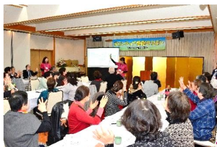
▲ボランティア感謝の集い