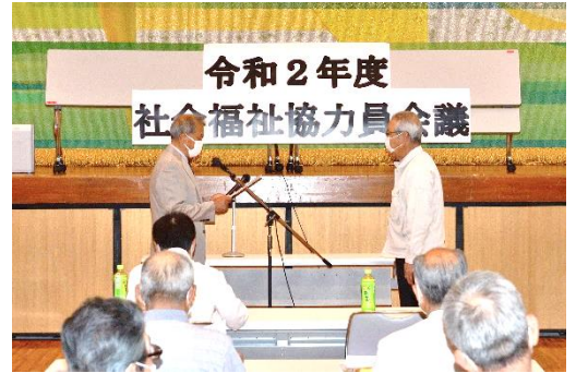
▲新任協力員の代表者へ委嘱状を交付

鎌田記念ホールの多目的ホールにて社会福祉協力員会議を開催しました。各行政区の区長と社会福祉協力員47名にご参加いただき、今年度の社協会費や共同募金の集約・納入のご依頼をさせていただきました。また、社協で行っている地域福祉事業・介護サービス事業・障がい福祉サービス事業についてご説明し、理解を深めていただく機会となりました。