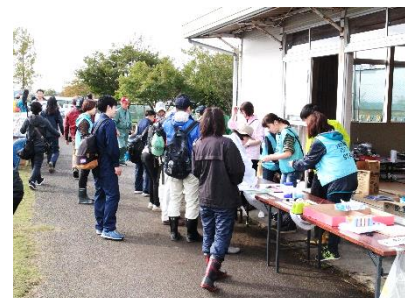
▲災害ボランティアセンターの運営(台風19号)