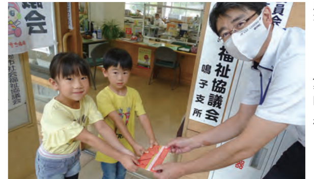
川渡カトリック保育園様