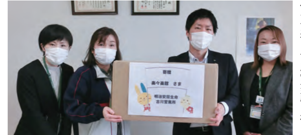
明治安田生命保険相互会社 仙台支社 古川営業所様