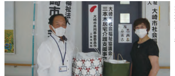
大崎商工会女性部 三本木支部様