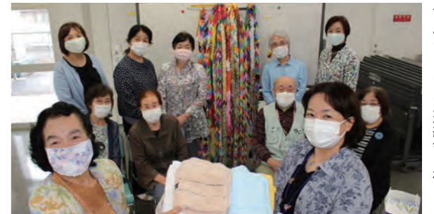
古川ボランティア連絡会様