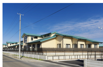
特別養護老人ホーム 楽々楽館(古川)