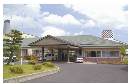
特別養護老人ホーム 敬風園(鹿島台)