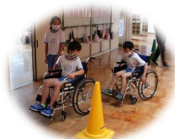
キャップハンディ体験 (車椅子)