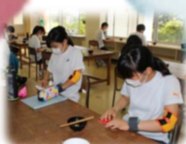
キャップハンディ体験 (非利き手)