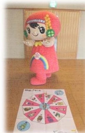
羽根っこゲーム干支セトラ