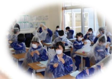
ゴミ袋で雨カッパ作り