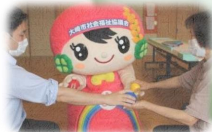
レクリエーション用品 (ソフトボール 90) を使ったレクリエーション