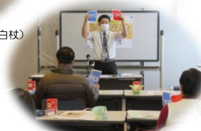
防災クロスロード