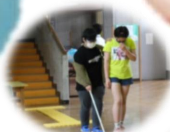
キャップハンディ体験 (白杖)