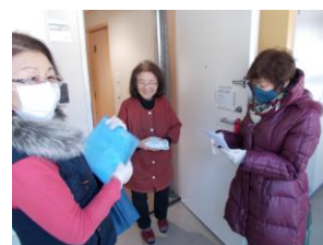
鳴子温泉住宅自治会様