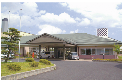
特別養護老人ホーム 敬風園(鹿島台)