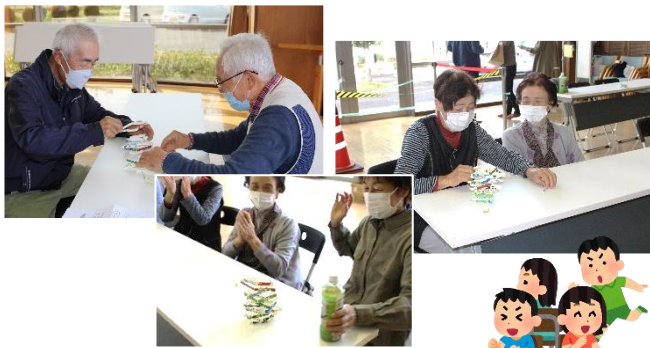
「牛乳パックタワーリレー」