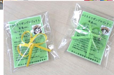
▲ 岩出山高校 様