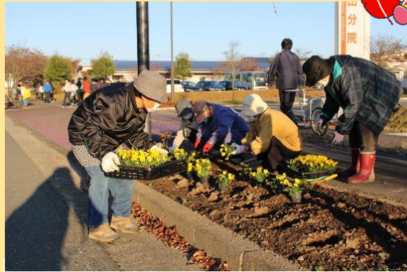
▲あったか村地域ふれあい事業での植栽活動(11/7実施)