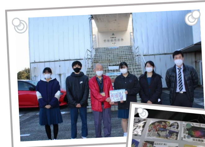
ことばのギフトカード▶