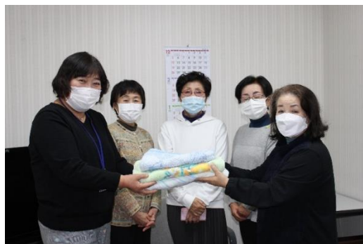
▲玉造更生保護女性会の皆様

お寄せいただいた物品は、 あったか村デイサービス センターで活用させて いただきます！