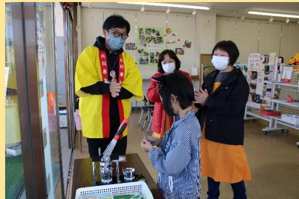
▲岩出山100縁商店街での活動 (10/30実施)