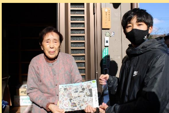
▲歳末まごころ訪問事業(12/23～実施)